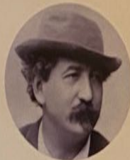
ANTOINE LUMIÈRE 1840 - 1911